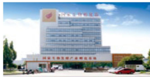
国家级生物制造孵化器和产业基地