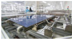
易能300MW铜铟镓薄膜太阳能电池

以贺友集团、浩阳新材料、国晶新材料和军钛金属为龙头，大力发展环保密度板、超高压电缆、土工合成新材料、高技术陶瓷、粉末冶金制品等产业。