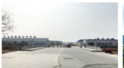
山东富嘉化纤织造有限公司