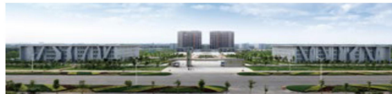
禹城市人力资源市场