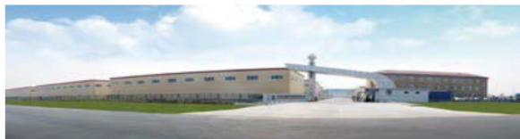
山东百龙创园生物科技股份有限公司