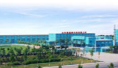
山东国晶新材料有限公司