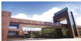
德州科技职业学院

禹城拥有劳动力 30 多万人，流动人口 20 万，建有人才交流中心、人力资源中介服务机构和 6 家专业定点培训机构，年培训各类专业技术人员 3 万余人，是京津地区重要的劳动力输出基地。