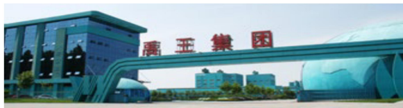
山东禹王实业（集团）有限公司