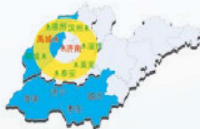
● 济南城市群经济圈 ● 西部经济隆起带