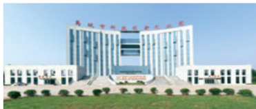
禹城市科技创新创业园

禹城市科技创新创业中心集科技创新创业园、理想空间科技企业孵化器、人才公寓于一体，为科研项目和高端人才从政策奖励、生产生活、到研发创业提供全方位服务，达到创新团队即需即用、高端人才拎包入住的标准，为创新创业者搭建了圆梦的舞台。