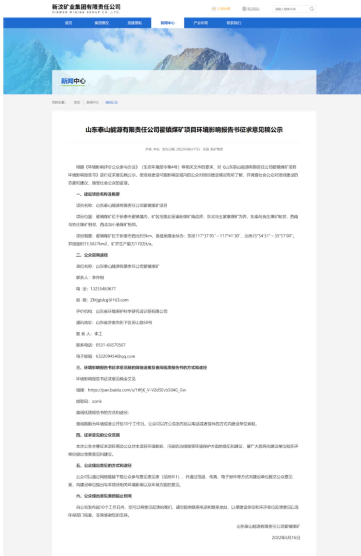
图 3.2-1 本项目征求意见稿公示网络截图