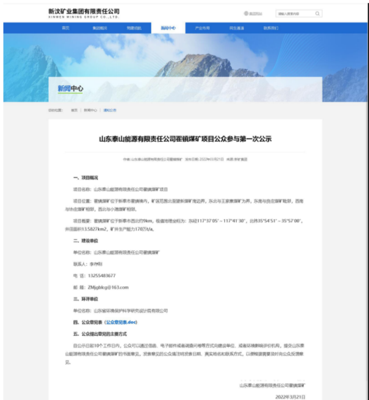
图 2.2-1 本项目首次环境影响评价信息公开网络截图