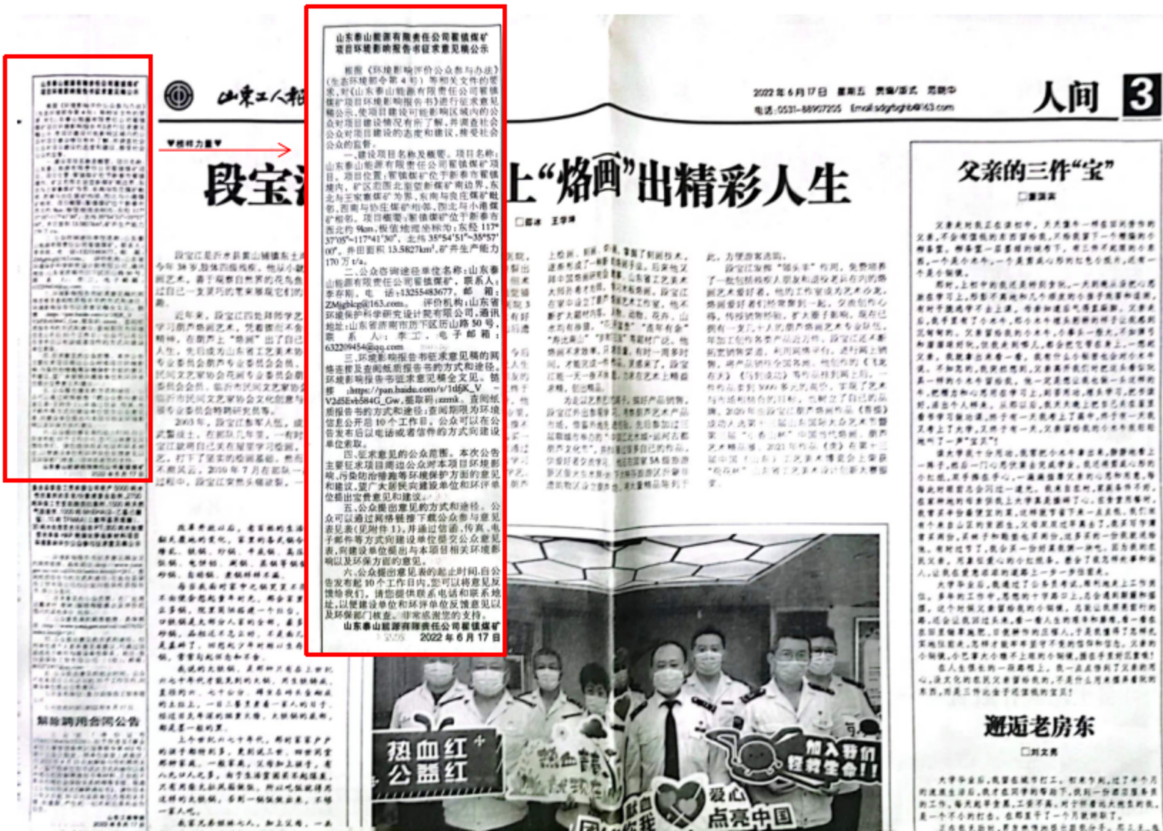
图 3.2-4 本项目环境影响报告书征求意见稿第二次报纸公示（6月17日）