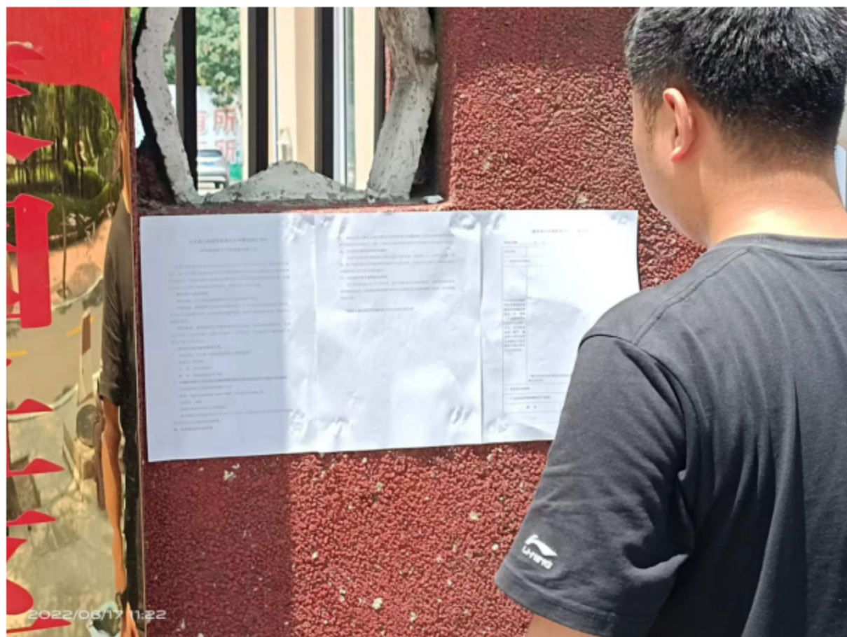
图 3.2 -2 张贴公示现场情况