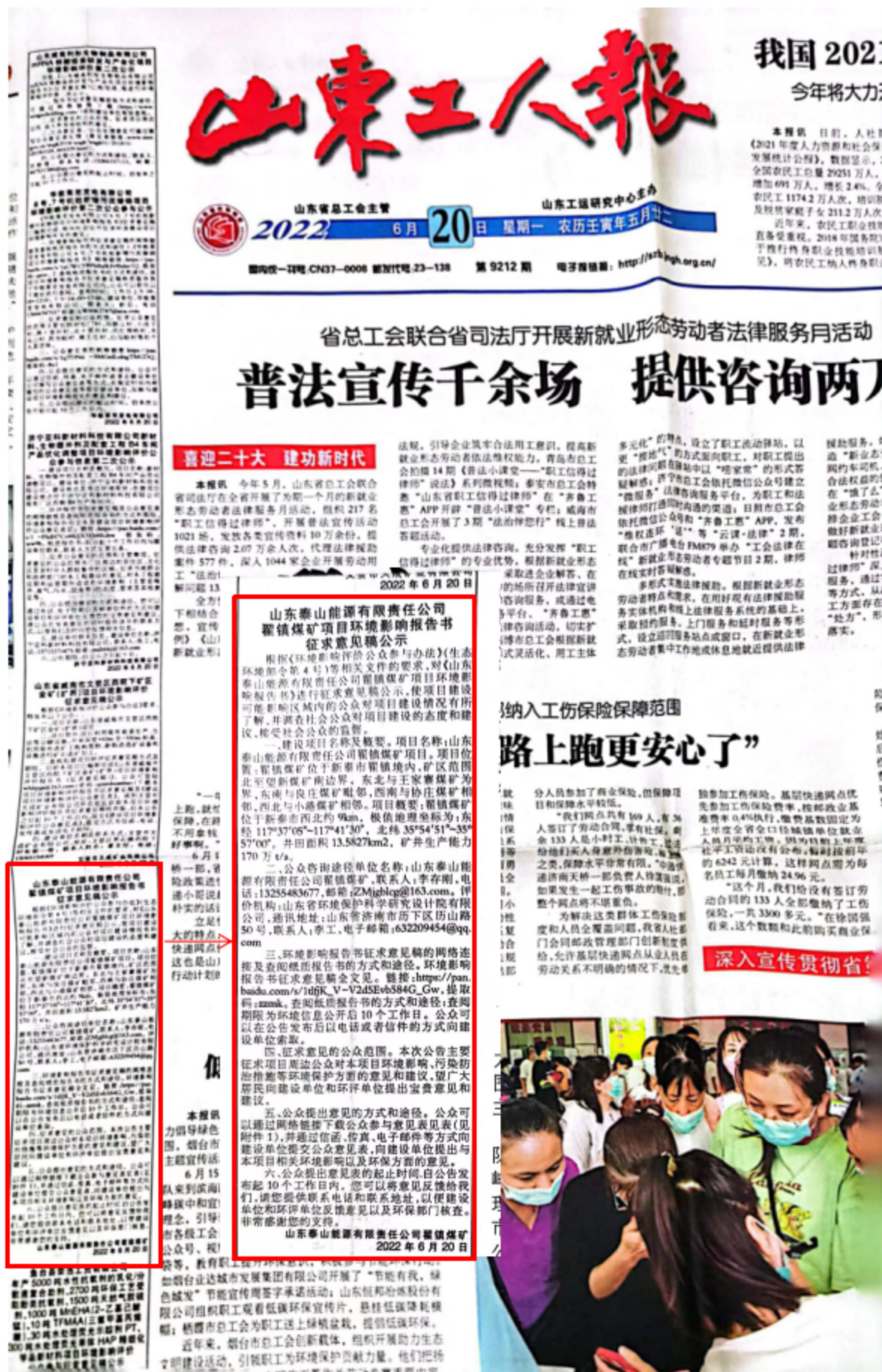
图 3.2-4 本项目环境影响报告书征求意见稿第二次报纸公示（6月20日）